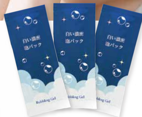
パッケージイメージ